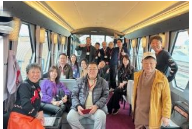
チケットが取れない！と言われているスペーシア X 1号車コックピットラウンジを貸切！