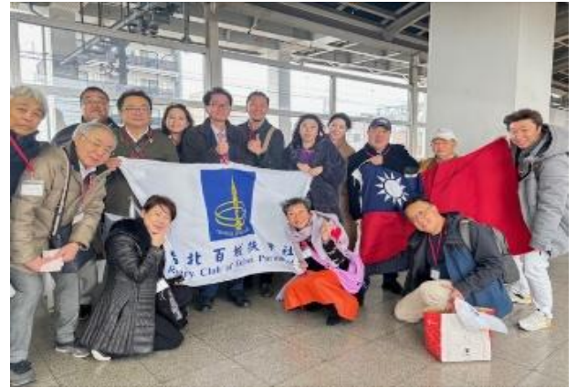
今回メインの 日光江戸村へ出発！