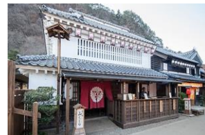
炭火焼 山くじら 美味しかったあ

9:13 北千住を出発し約2時間半で日光江戸村に到着 記念写真を撮った後はみんなで 忍者劇場でのショーを見学 その後 はマップを見ながら それぞれ自由行動で楽しみました