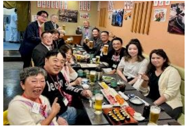
ホテル前にある「きづな寿司」で歓迎食事会