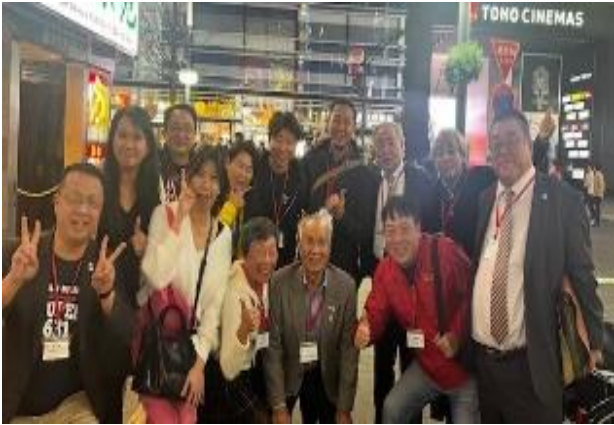
5年ぶりの再会とは思えない盛り上がり！