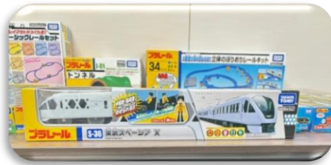
スペースXも既に発売されていました