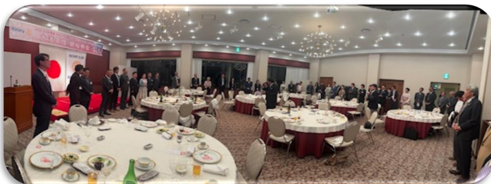
全員で 手に手つないで 合唱