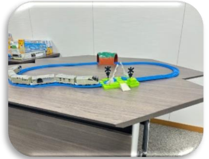
踏切りも本物似で作られています