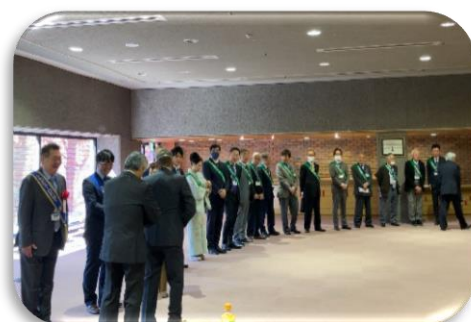
越谷南RCの皆様が会場前でお出迎え