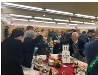
中クラブ & 南クラブ 合同席でした

横浜中華学校生徒達が獅子の上半身と下半身を操り会場内を銅鑼の音に合わせて駆け回りました。途中観客は獅子の口に紅包(台湾のお年玉)を差し入れる様子もありました。