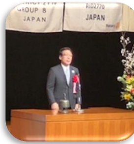
梨本ガバナーご挨拶