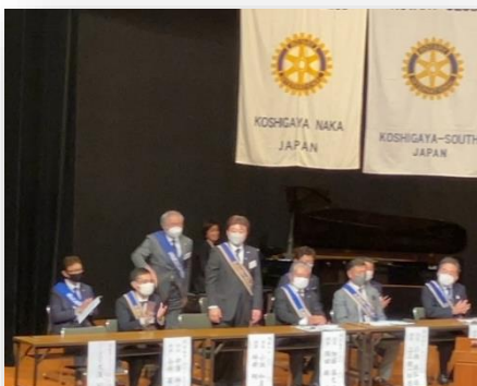
各クラブ会長・幹事紹介