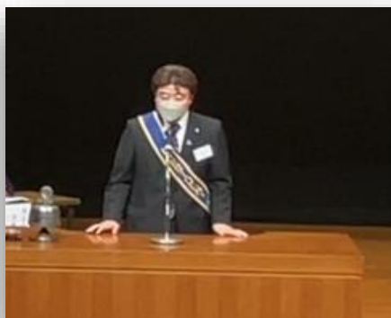
各クラブ会長挨拶：小池会長