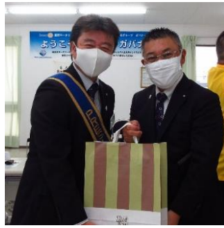
大濱ガバナー補佐幹事 有難うございました