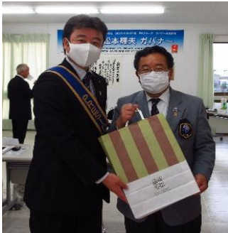
松本ガバナー 有難うございました