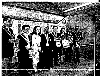
東京米山友愛RCとのバナー交換