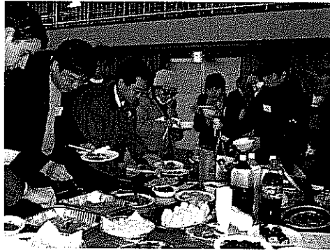
炒めた野菜を焼いた皮で巻き 特性のタレをかければ出来上がり