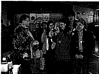
記念写真を撮り合う留学生たち