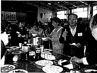
箸の使い方も慣れたもの