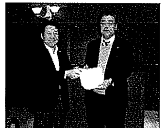
大野会員へRLI修了書贈呈